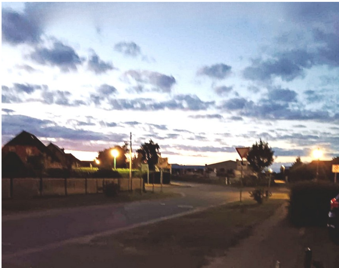
Morgens in Warsow